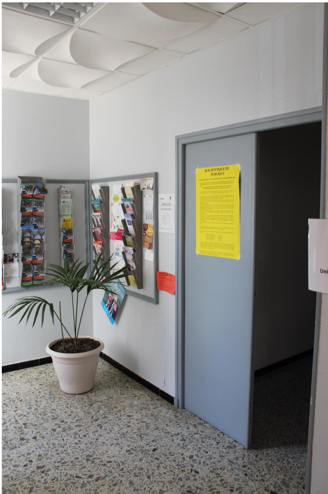
Affichage à l'intérieur de la mairie