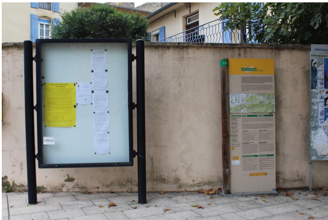
Affichage route d'Uzès