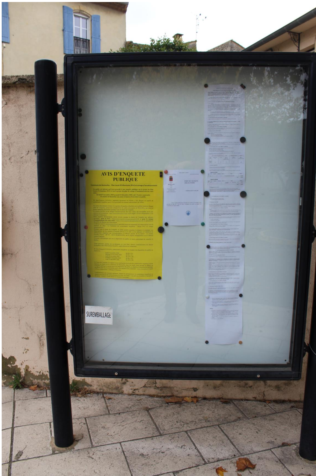
Affiche route d'Uzès