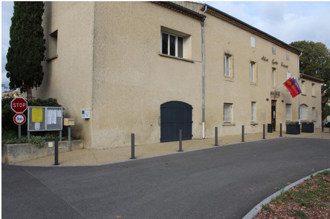
Panneau à l'extérieur de la mairie