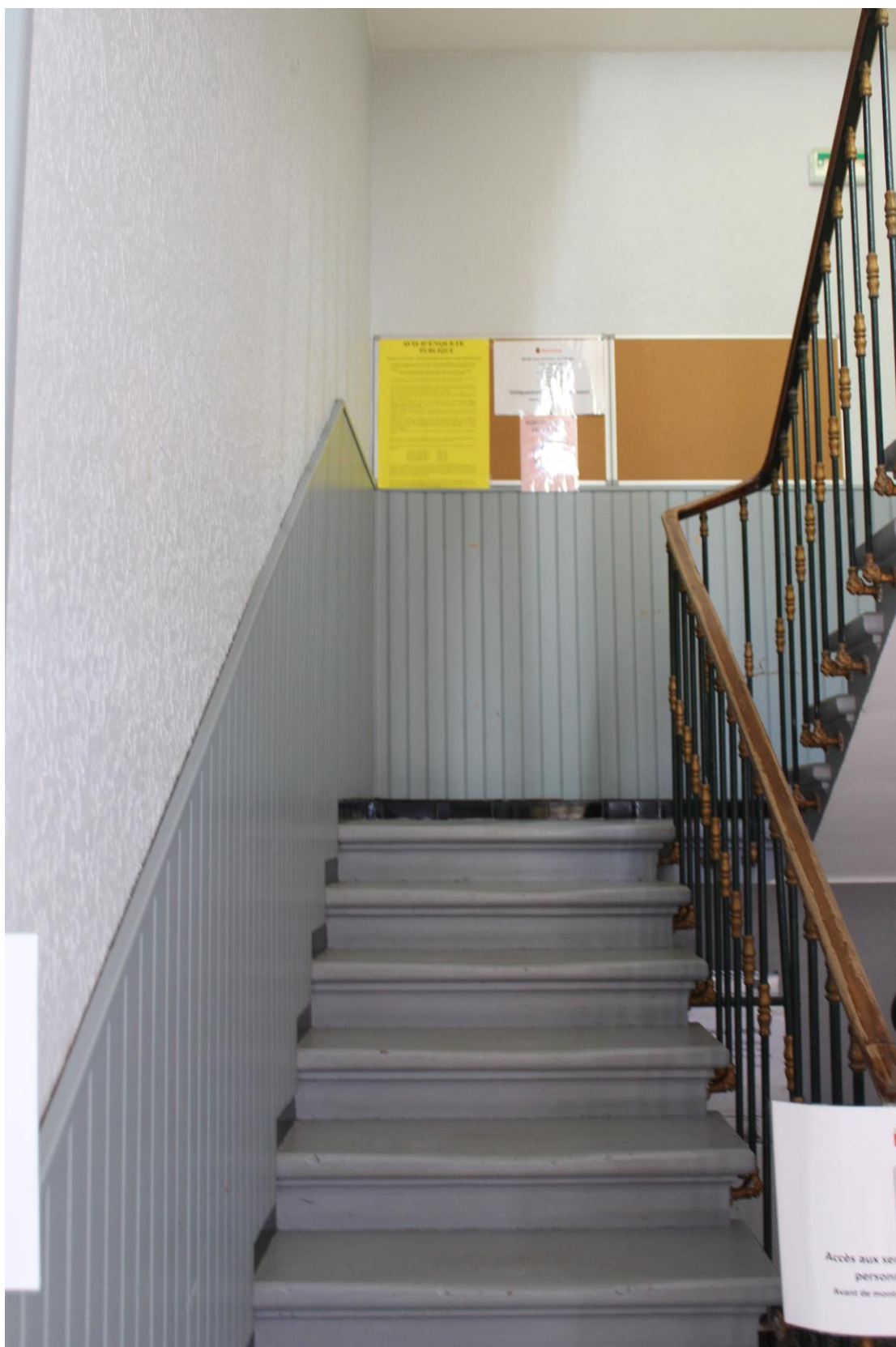
Affichage à l'intérieur de la mairie