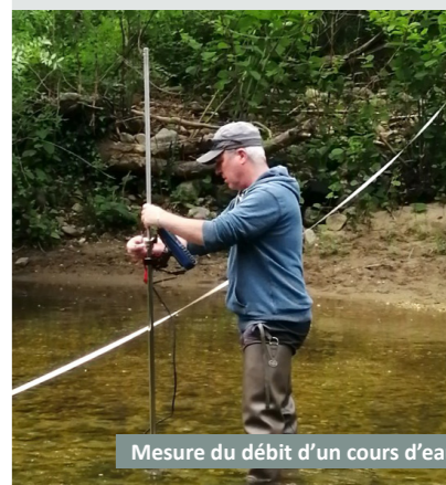
Mesure du débit d'un cours d'eau

Fin avril, notre bassin est dans une situation très tendue. Après une sécheresse très forte durant l'été 2022 mais des pluies proches de la normale fin 2022, le début d'année est marqué par des quantités de pluie très faibles. Plusieurs cours d'eau ou nappes d'eaux souterraines sont à des niveaux très bas, dans les plus faibles valeurs connues pour la même époque de l'année.