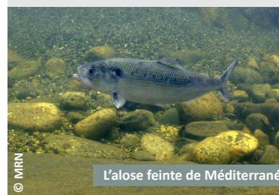
L'aloise feinte de Méditerranée

L'Alose Feinte vit en Méditerranée et vient se reproduire dans nos cours d'eau entre avril et juin. Ce poisson migrateur adopte alors un comportement caractéristique : il frappe l'eau avec sa nageoire caudale (on parle de « bull »), ce qui facilite son comptage et l'estimation de sa population.