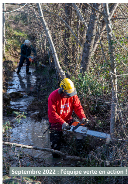
Septembre 2022 : l'équipe verte en action !

En complément du travail d'entreprises prestataires et de 3,5 agents mis à disposition (Alès Agglo et Galeizon)