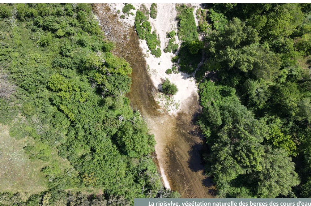
La ripisylve, végétation naturelle des berges des cours d'eau

Pour intervenir, non plus sur les rives mais dans les cours d'eau à forte valeur patrimoniale, la période optimum de travaux est inversée : afin de bénéficier des basses eaux et ne pas perturber la reproduction de certains poissons.