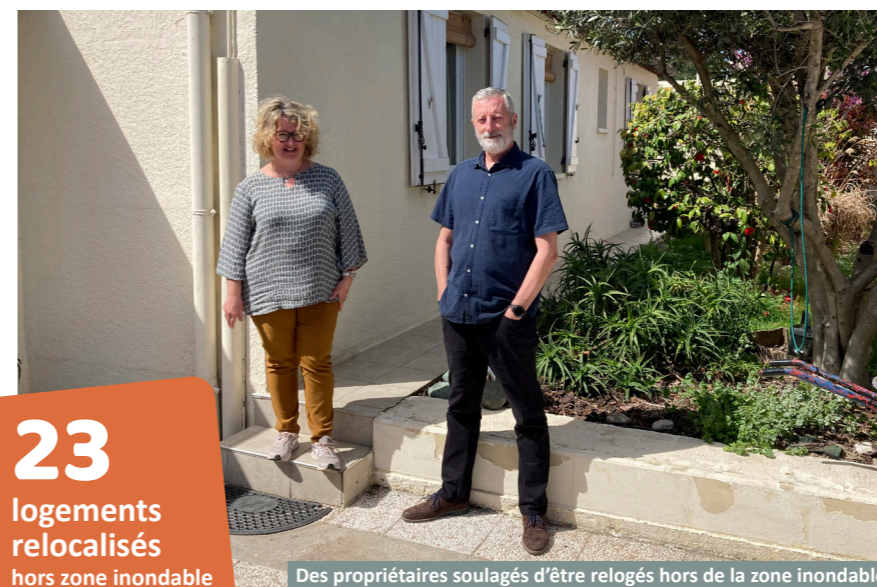
Des propriétaires soulagés d'être relogés hors de la zone inondable

L'EPTB Gardons mène ce projet avec un financement de 50% de la part de la communauté d'Alès Agglomération et une subvention de 50% (ou 100% en fonction des dossiers) de la part de l'État.