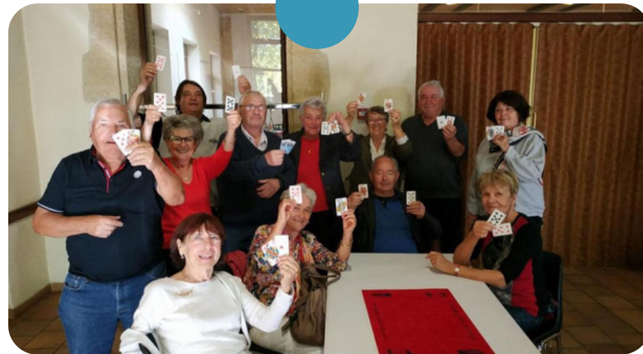
SEMAINE BLEUE PORTÉE PAR LE CCAS