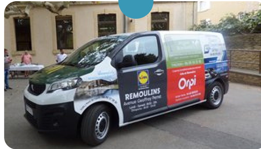
NAVETTE ÉLECTRIQUE COMMUNALE

pour faciliter les déplacements des seniors et des associations