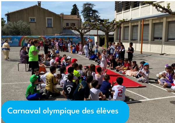
Carnaval olympique des élèves