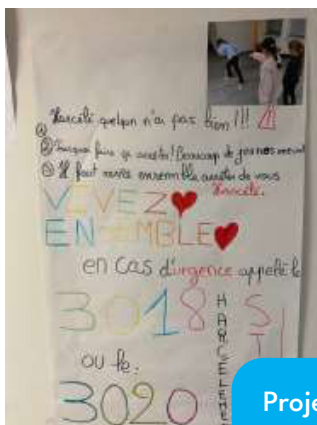
Projet de lutte contre le harcèlement