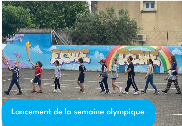
Lancement de la semaine olympique