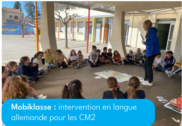
Mobiklasse : intervention en langue allemande pour les CM2