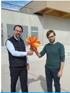
Passage de la flamme de circonscription de toutes les écoles autour de Remoullins jusqu'au collège.