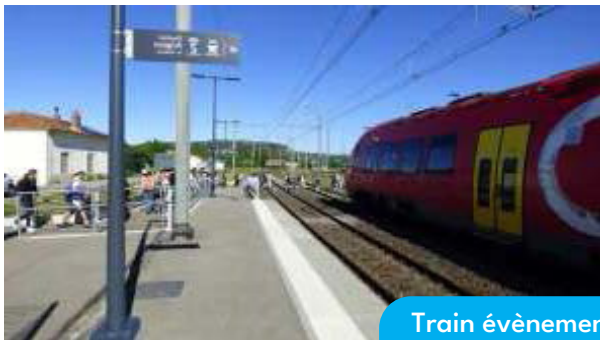
Train évènementiel Remoullins-Nîmes Visite de Nîmes et du musée