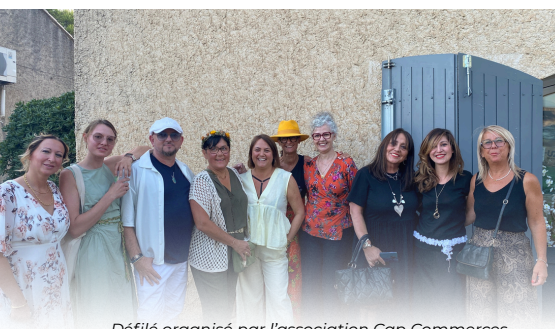
Défilé organisé par l'association Cap Commerces