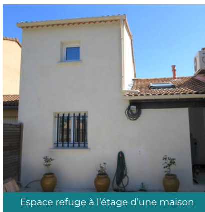
Espace refuge à l'étage d'une maison

A l'issue du diagnostic, l'équipe Gardons ALABRI accompagne les propriétaires pour la réalisation des travaux en facilitant l'obtention de 80% de subvention de la part de l'État. 20% supplémentaires de la part du Département du Gard sont possibles sous condition de ressource.