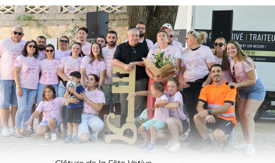
Clôture de la Fête Votive