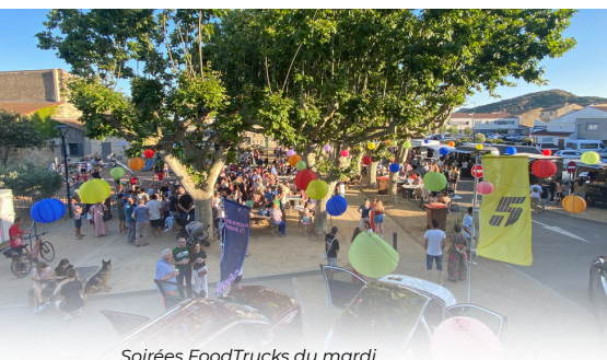
Soirées FoodTrucks du mardi

MUSIQUE, FÊTES ET PARTAGES RETOUR SUR UNE SAISON ESTIVALE ANIMÉE