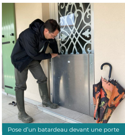
Pose d'un batardeau devant une porte

L'EPTB Gardons a lancé Gardons ALABRI, une vaste opération de diagnostics gratuits des logements situés en zone inondable !